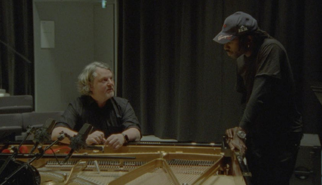
A different score , Devonté Hynes, 2023, film, 31 min, vost, capture d'écran