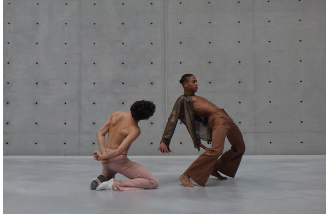
Gerard & Kelly, Panorama , 2021. Vidéo 4K, couleur, son, 22 min, Germain Louvet et Guillaume Diop. Courtesy les artistes et la galerie Marian Goodman © Adagp Paris, 2023

+ Danseurs et danseuse du Ballet de l'Opéra national de Paris * Membre fondateur de AMOC*