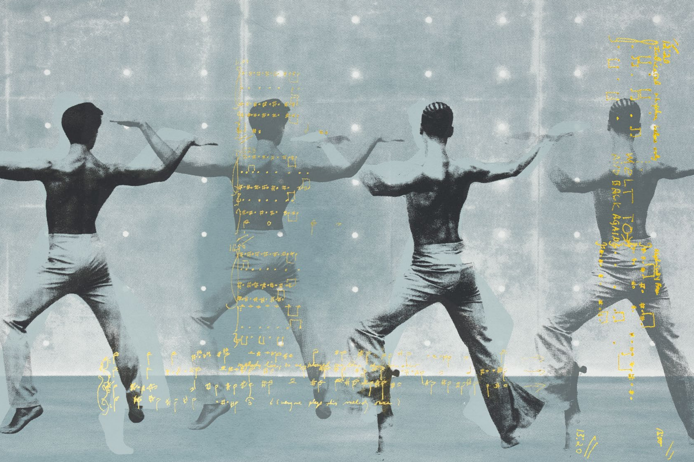
Gerard & Kelly, Glyphs V , 2023, Sérigraphie monotype, feuille d'argent et d'or sur papier métallique. Deux parties: 40 x 90 cm chacune, Courtesy les artistes et la galerie Marian Goodman. © Adagp Paris, 2023.