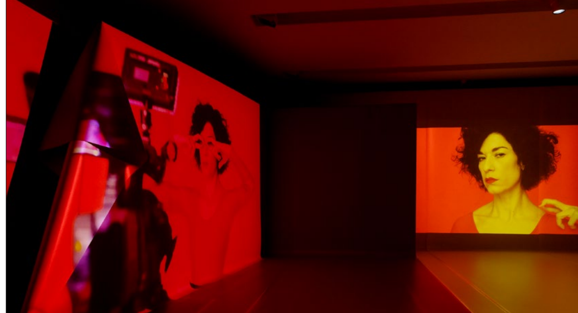
Vue d'exposition « Alexandra Bachzetsis. 2020: Obscene », (Kunsthau Zürich, 2022)

La nouvelle performance de Dorota Gawęda & Eglė Kulbokaitė s'inscrit dans le temps long d'une journée. Intitulée Brood , en référence aux clichés du film d'horreur, elle se concentre sur les moments où les identités se mélangent, le corps n'étant pas une frontière à contenir et surveiller mais une entité poreuse avec ses fuites et ses déversements nous reliant au monde. La performance prend place dans plusieurs espaces, entre l'installation Sulk du Niveau -1, la Petite salle et l'environnement virtuel de la transmission vidéo.