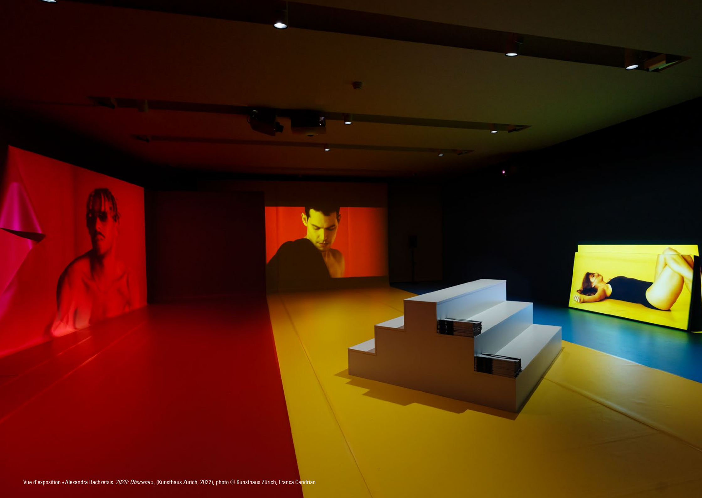
Vue d'exposition «Alexandra Bachzetsis. 2020: Obscene », (Kunsthau Zürich, 2022)