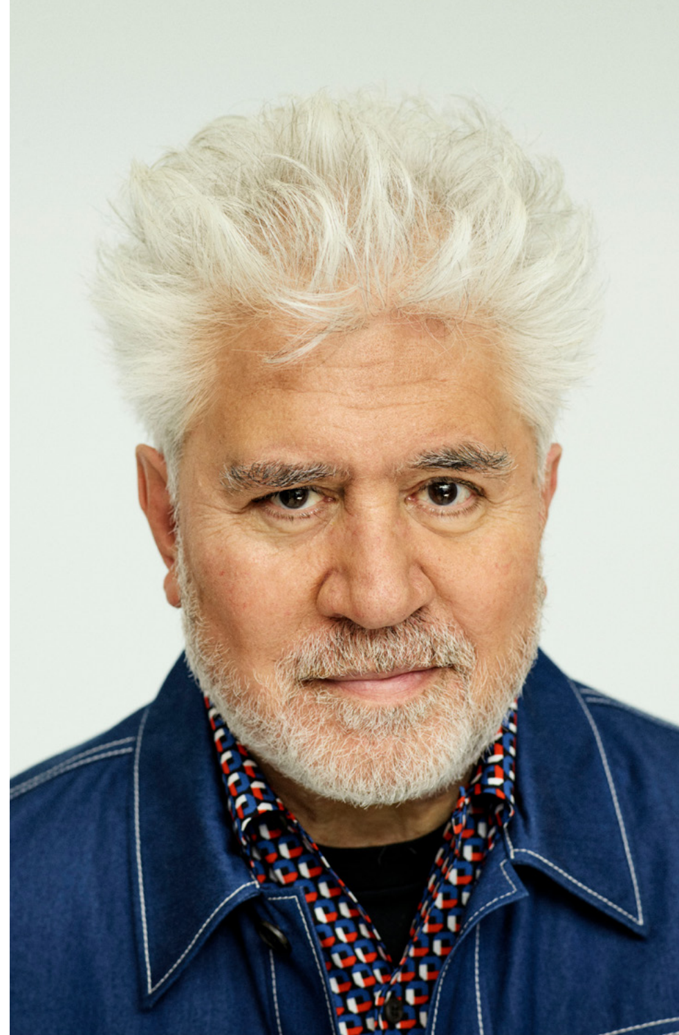
Pedro Almodóvar

Ici, « chaque centimètre des trois mille mètres de pellicule déborde de passion », écrit le cinéaste dans une auto-interview. Couples imparfaits et désirs ambivalents, réciprocity différées, violence et naïveté : les formes de l'amour tressent leurs pulsions entre elles, tandis que le cinéaste explore aussi les liens unissant un frère et une sœur. Un grand film flamboyant, matrice des chefs-d'œuvre plus mélancoliques d'Almodóvar.