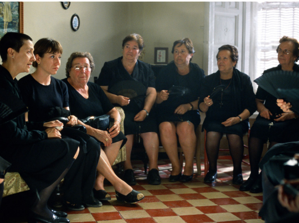
Volver , Pedro Almodóvar, 2006