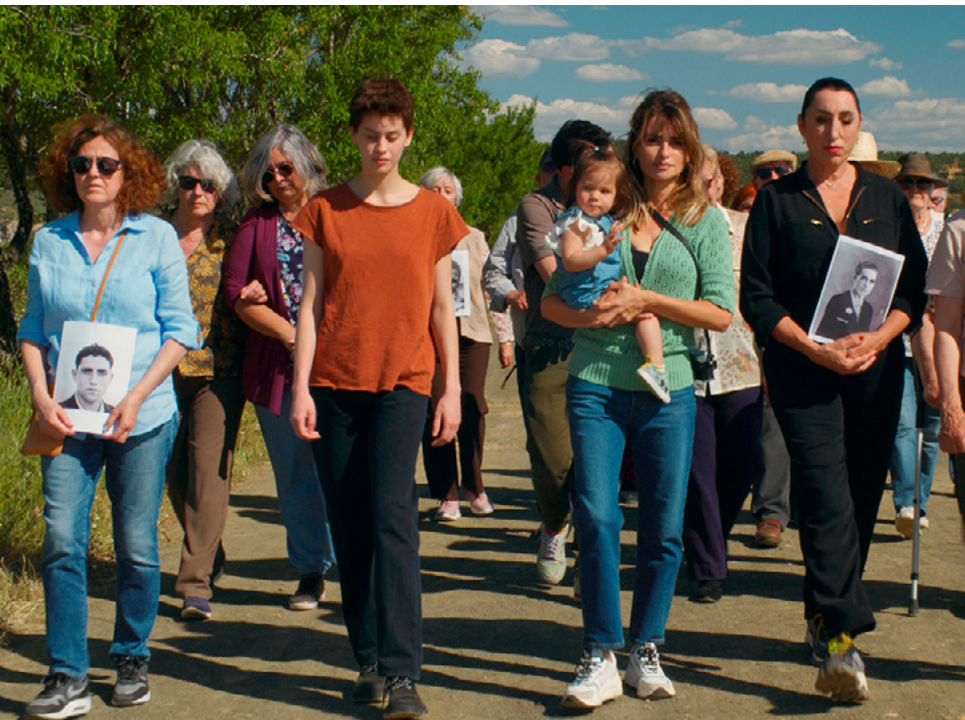
Madres Paralelas , Pedro Almodóvar, 2021