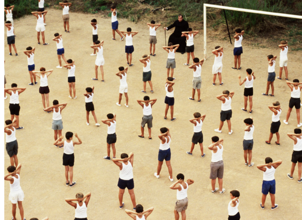
La Mauvaise éducation , Pedro Almodóvar, 2004