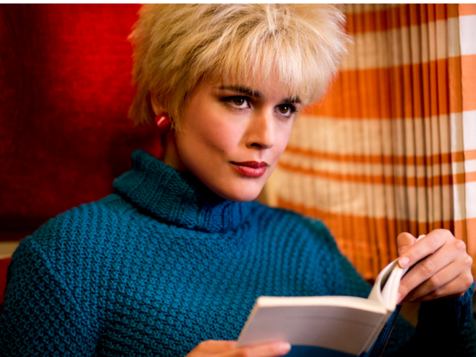
Julieta , Pedro Pedro Almodóvar, 2016