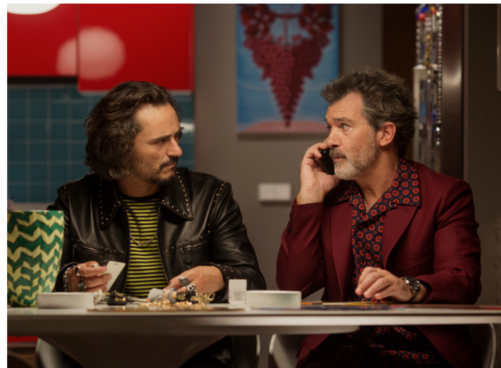
Dolleur et gloire , Pedro Almodóvar, 2019