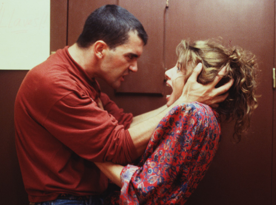
Attache-moi! , Pedro Almodóvar, 1990