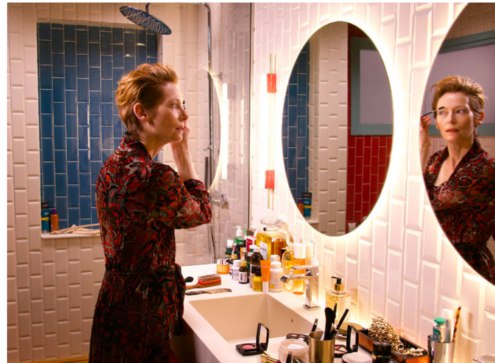
La Voix humaine , Pedro Almodóvar, 2020