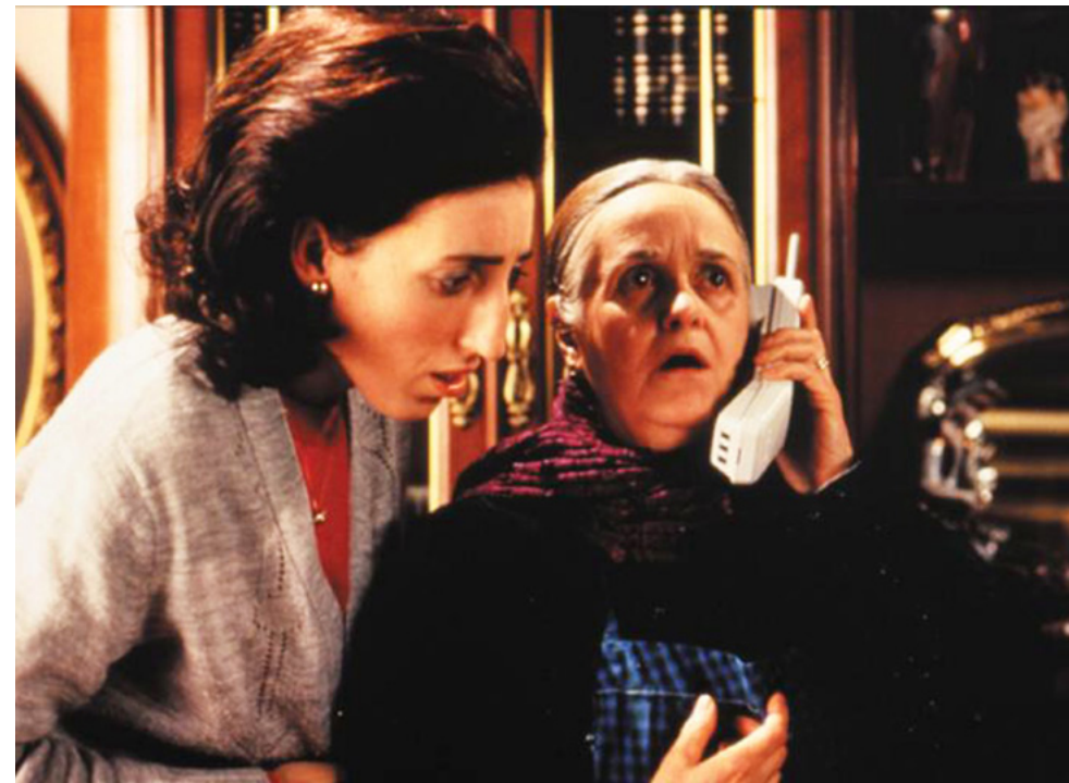
La Fleur de mon secret , Pedro Almodóvar, 1995