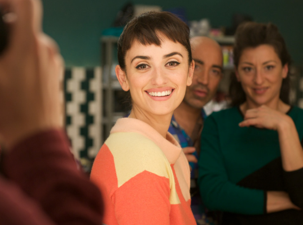
Étreintes brisées , Pedro Almodóvar, 2009