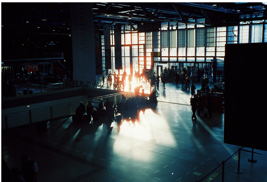
Centre Pompidou