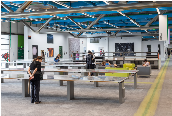
Vue de l'exposition « Wolfgang Tillmans. Tout nous y préparait – Rien ne nous y préparait », du 13 juin au 22 septembre 2025

Au printemps, « Énormément bizarre. La collection Jean Chatelus, donation de la fondation Antoine de Galbert » a intrigué 104 596 visiteur-euse-s qui se sont imprégné-e-s de l'univers hors norme d'une collection unique au monde. Dans la galerie voisine, « Hans Hollein – transFORMS » mettait à l'honneur l'architecte pluridisciplinaire dans un parcours retraçant sa carrière ( 79 536 visiteur-euse-s ).