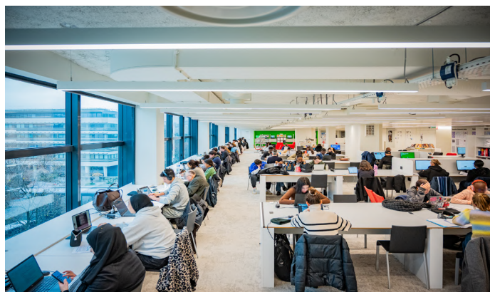
Bibliothèque publique d'information, bâtiment Lumière