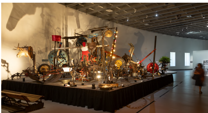
Vue de l'exposition « Niki de Saint Phalle, Jean Tinguely, Pontus Hulten » au Grand Palais avec le Centre Pompidou, du 26 juin 2025 au 4 janvier 2026