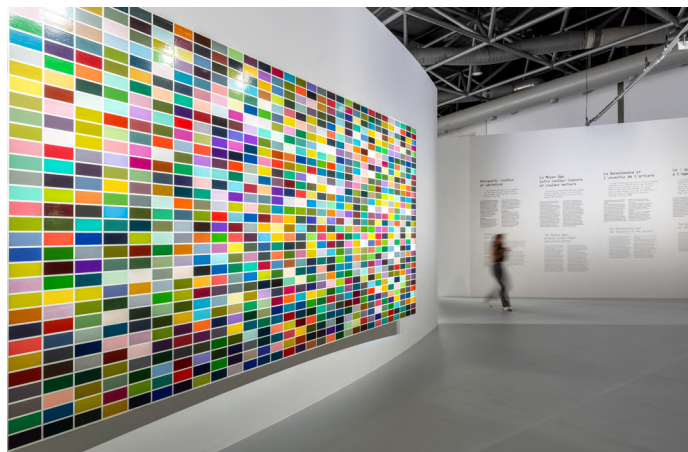
Vue de l'exposition « Couleurs ! Chefs-d'œuvre du Centre Pompidou » GRIMALDI FORUM MONACO - Éric Zaragoza - Exposition- Tableaux - Multicolors - 126