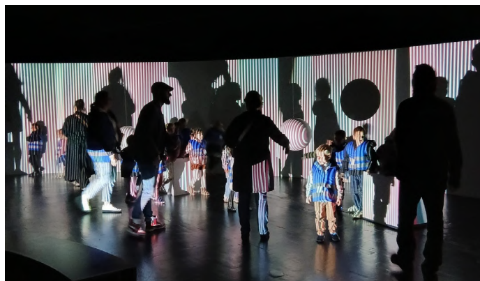
Vue de l'exposition « Pom Pom Pidou » au tripostal de Lille, du 26 avril au 9 novembre 2025

Le Centre Pompidou a rayonné au-delà des frontières dans le cadre de collaborations inédites telles que « Couleurs ! Chefs-d'œuvre du Centre Pompidou » , au Grimaldi Forum Monaco (plus de 75 000 visiteur-euse-s, soit près de 1 400 par jour) — l'exposition est aujourd'hui en itinérance et sera visible dès le 24 janvier 2026 au Minsheng Museum à Pékin — ainsi que de partenariats renouvelés, comme pour le Centre Pompidou Málaga ou le West Bund Museum Centre Pompidou à Shanghai.