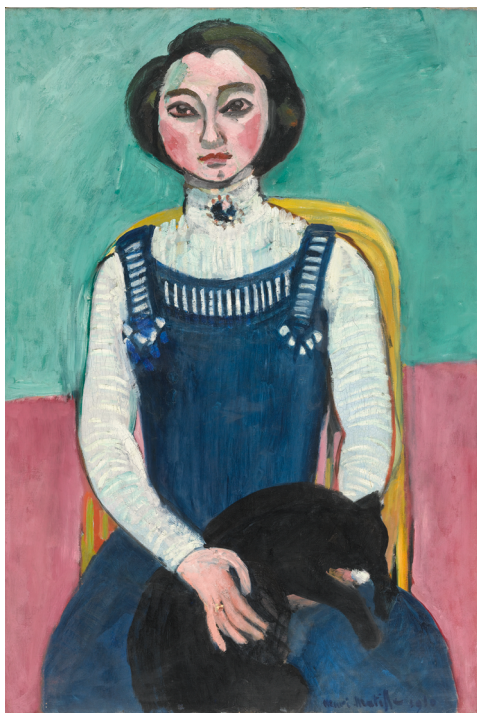
Henri Matisse, Marguerite au chat noir , 1910 Huile sur toile 94 x 64 x 2,3cm. Don de Barbara Duthuit en mémoire de Claude Duthuit, 2013 Collection Centre Pompidou, Paris Musée national d'art moderne - Centre de création industrielle Domaine public

COMMUNIQUÉ DE PRESSE | EXPOSITION ITINÉRANTE