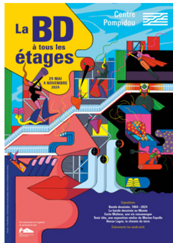
Illustration © Fanny Michaëlis