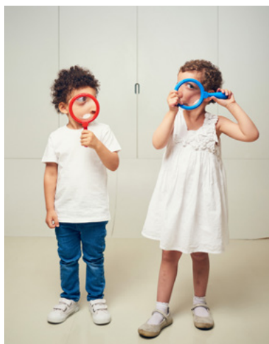
Atelier des enfants

Un atelier en écho à l'exposition temporaire « Paris Noir » 15 mars – 30 juin 2025 Ville de fête, de tumulte autant que d'harmonie, Paris est un lieu de rencontres et de dialogues. Cosmopolite, la ville se développe au travers des identités qui la composent, l'habitent et la nourrissent. À partir des œuvres de l'exposition « Paris Noir », les élèves jouent des contrastes de l'espace urbain : entre couleurs et textures, rythmes et échelles... La ville devient objet d'expérimentation.