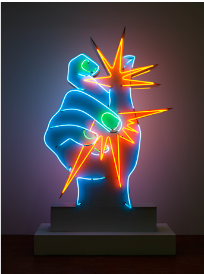
Martial Raysse, America America, 1964 Collection Centre Pompidou. Musée national d'art moderne – Centre de création industrielle.