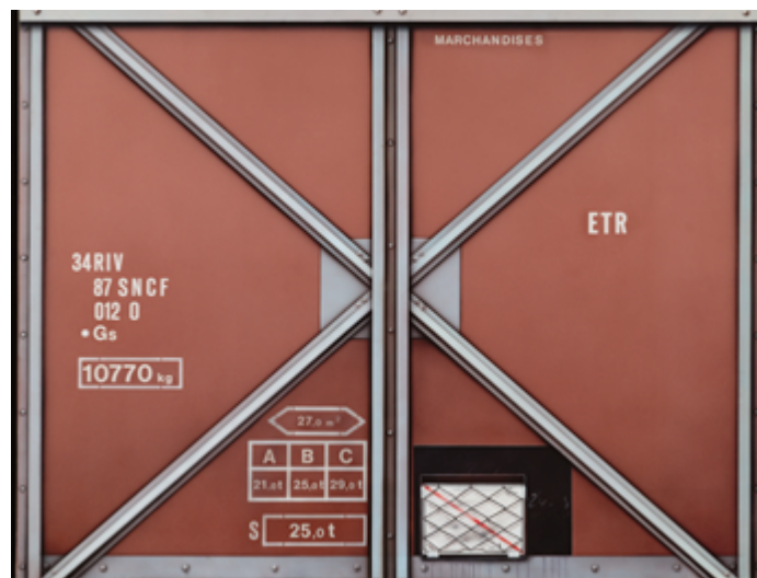
Peter Klasen, Etr , 1974. Peinture acrylique sur toile, 114 x 146 cm. Collection Centre Pompidou, Paris. Musée national d'art moderne – Centre de création industrielle. © Adagp, Paris, 2025.