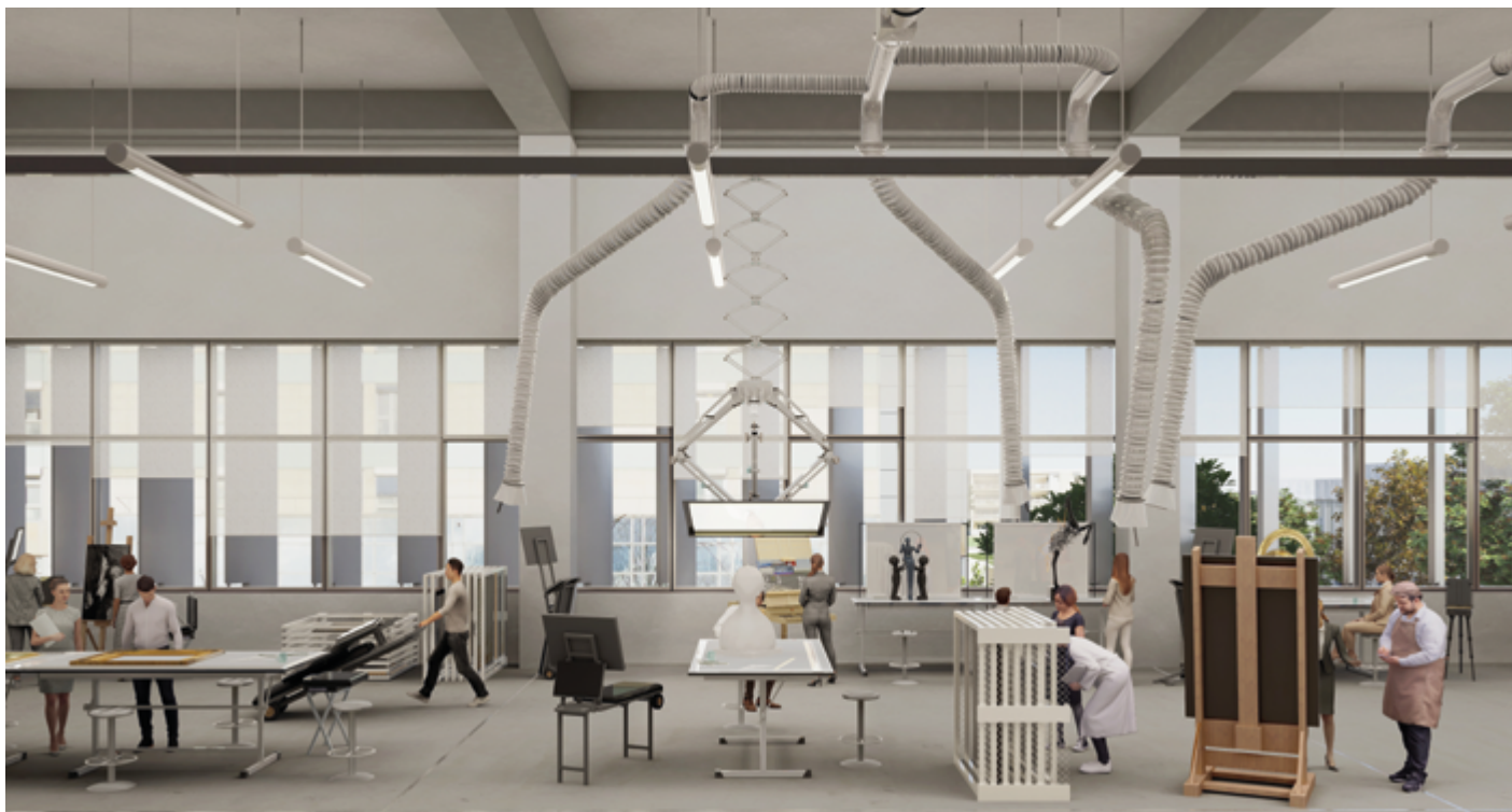
© PCA-STREAM - Représentation conceptuelle susceptible d'évoluer