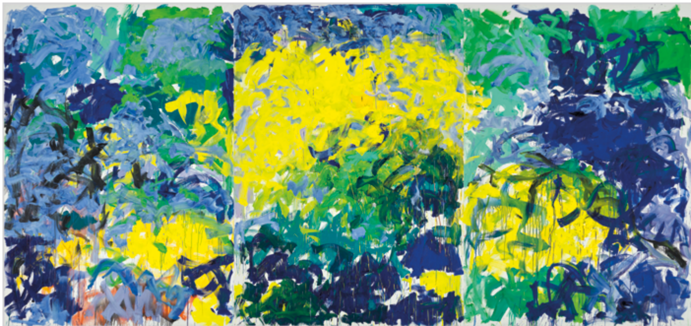
Joan Mitchell, La Grande Vallée XIV (For a Little While) , 1983 - Collection Centre Pompidou. Musée national d'art moderne - Centre de création industrielle © Estate Joan Mitchell

Riche de 150 000 œuvres, la collection du Centre Pompidou – Musée national d'art moderne est la première collection d'art moderne et contemporain en Europe. Elle est l'un des ensembles mondiaux de référence pour l'art des 20 e et 21 e siècles. La multidisciplinarité des œuvres et la richesse de vastes ensembles permettent d'exposer et d'éclairer les mouvements fondateurs et les figures magistrales de l'art moderne et contemporain.