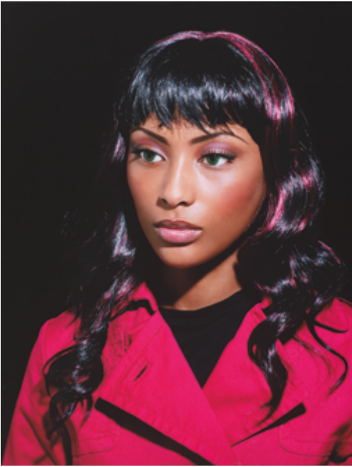
Valérie Belin, Sans titre , 2006 Collection Centre Pompidou. Musée national d'art moderne – Centre de création industrielle – © ADAGP, Paris, 2025