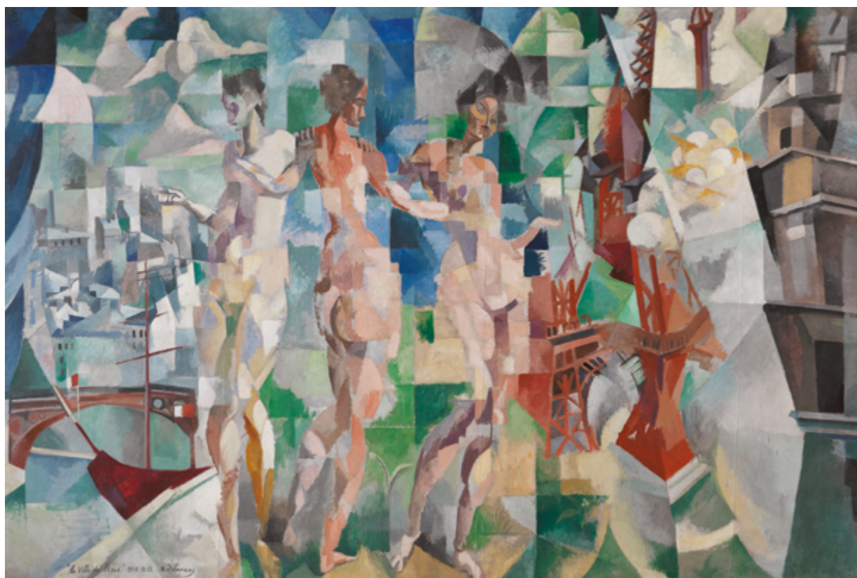
Robert Delaunay, La Ville de Paris, 1910-1912 Collection Centre Pompidou, Musée national d'art moderne – Centre de création industrielle Domaine Public