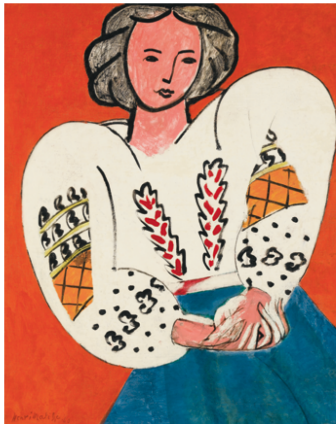
Henri Matisse, La Blouse roumaine , 1940 – Collection Centre Pompidou. Musée national d'art moderne – Centre de création industrielle. Domaine Public