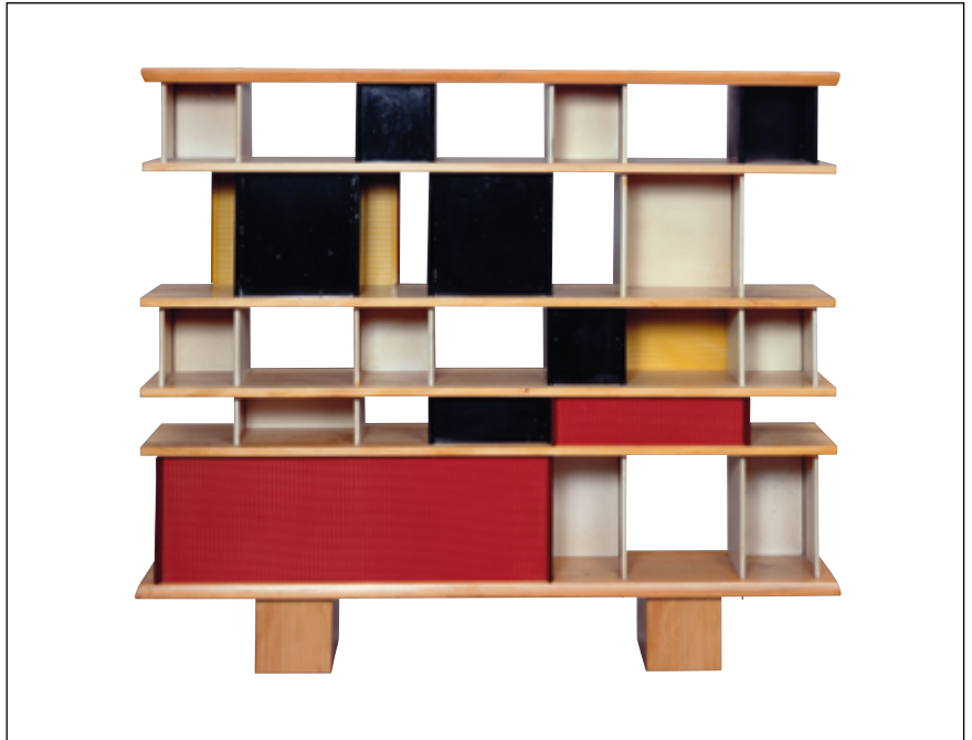
Charlotte Perriand, Bibliothèque de la Maison du Mexique , 1952 Collection Centre Pompidou. Musée national d'art moderne – Centre de création industrielle © Adagp, Paris, 2025

La collection d'art graphique du Centre Pompidou compte plus de 20 000 dessins et estampes. Ce fonds s'est considérablement enrichi avec le temps.