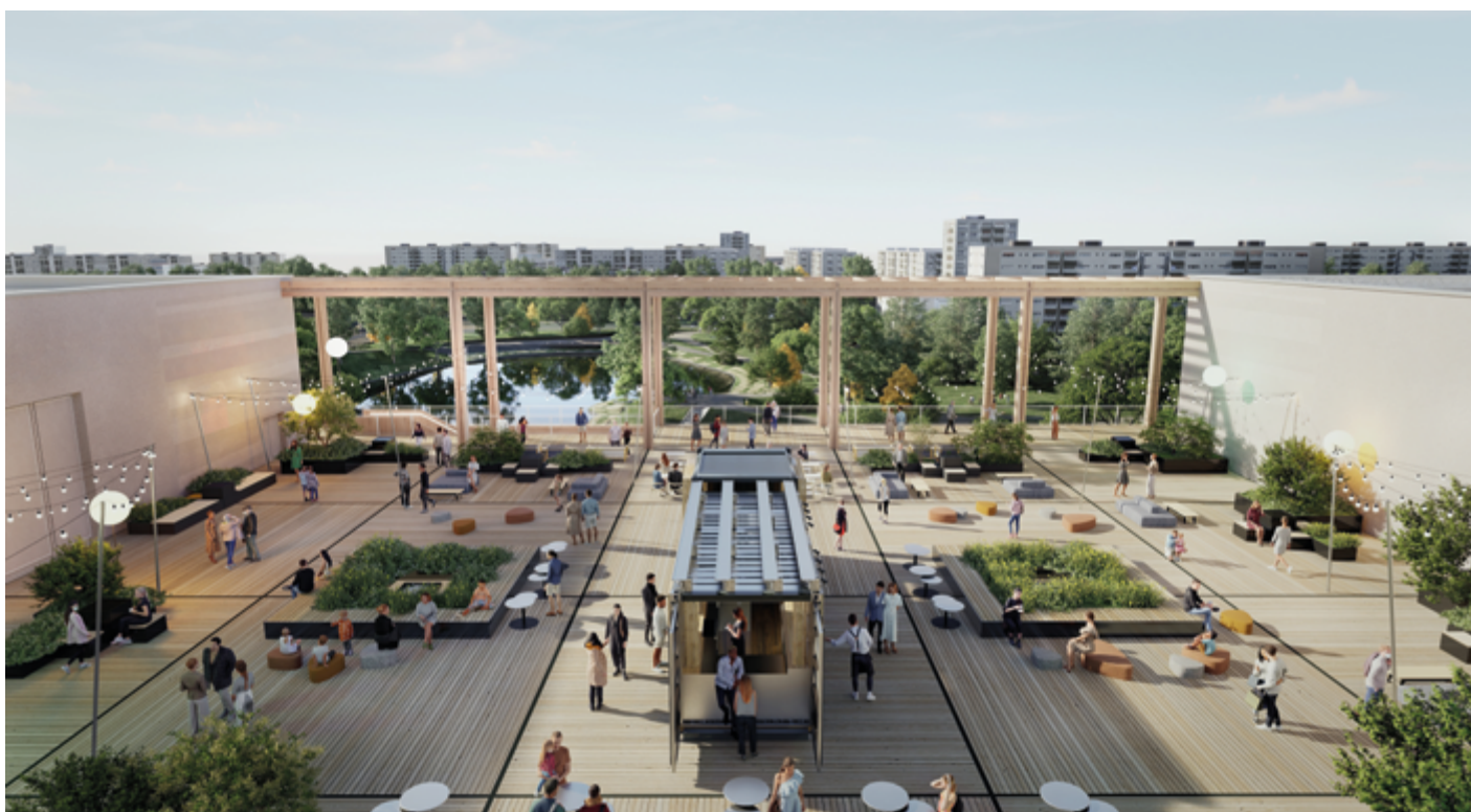
© PCA-STREAM - Représentation conceptuelle susceptible d'évoluer