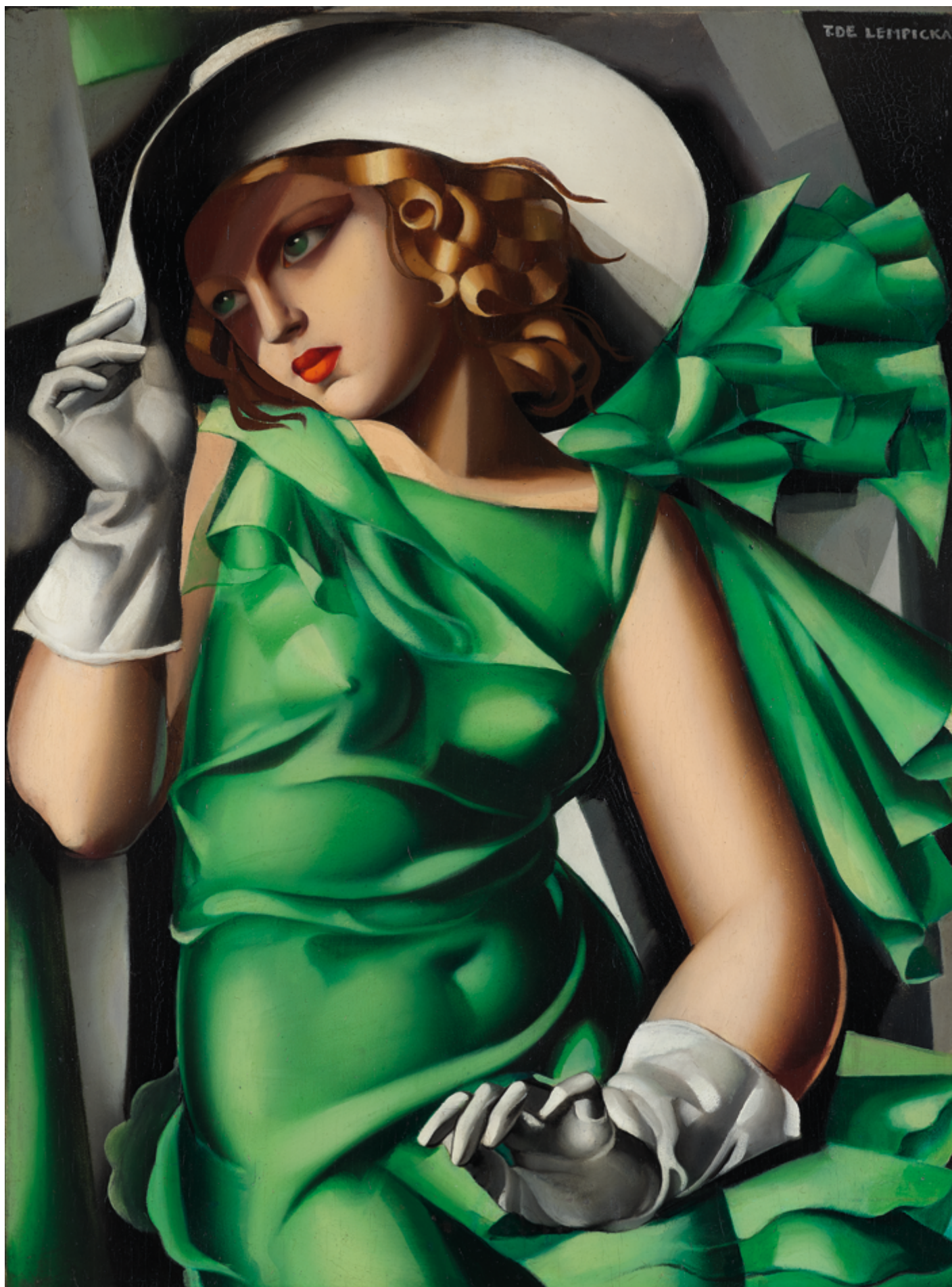
Tamara de Lempicka, Jeune fille en vert, 1927-1930 - Collection Centre Pompidou. Musée national d'art moderne - Centre de création industrielle. © Tamara de Lempicka Estate, LLC / Adagp, Paris, 2025