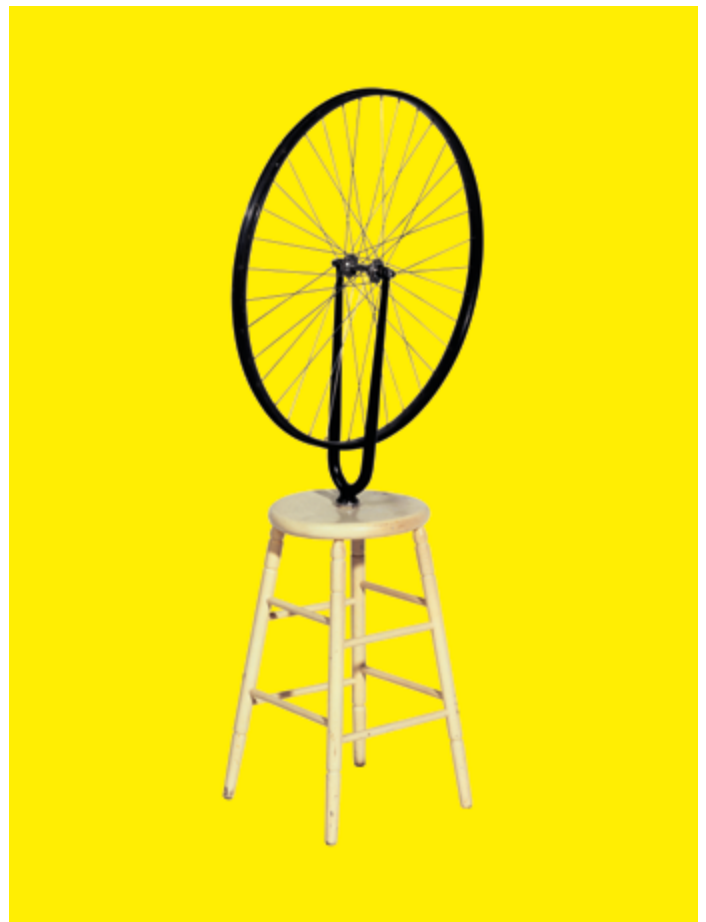
Marcel Duchamp, Roue de bicyclette , 1913 / 1964 Collection Centre Pompidou. Musée national d'art moderne – Centre de création industrielle © Association Marcel Duchamp / Adagp, Paris, 2025