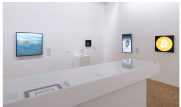
NFT Poétiques de l'immatériel du certificat à la blockchain.

En charge de collections patrimoniales, la Bibliothèque Kandinsky conserve plus de 18 000 œuvres imprimées d'artistes majeurs du 20 e et 21 e siècles, témoignant de l'extension des pratiques artistiques aux divers supports de la reproduction imprimée. Foncièrement pluridisciplinaire, cet ensemble exceptionnel regroupe manuscrits, imprimés, photographies, films ou vidéos. Résolument international, il se déploie à travers plus de 180 fonds d'archives qui témoignent de la diversité des acteurs ayant contribué au mouvement des arts modernes et contemporains.