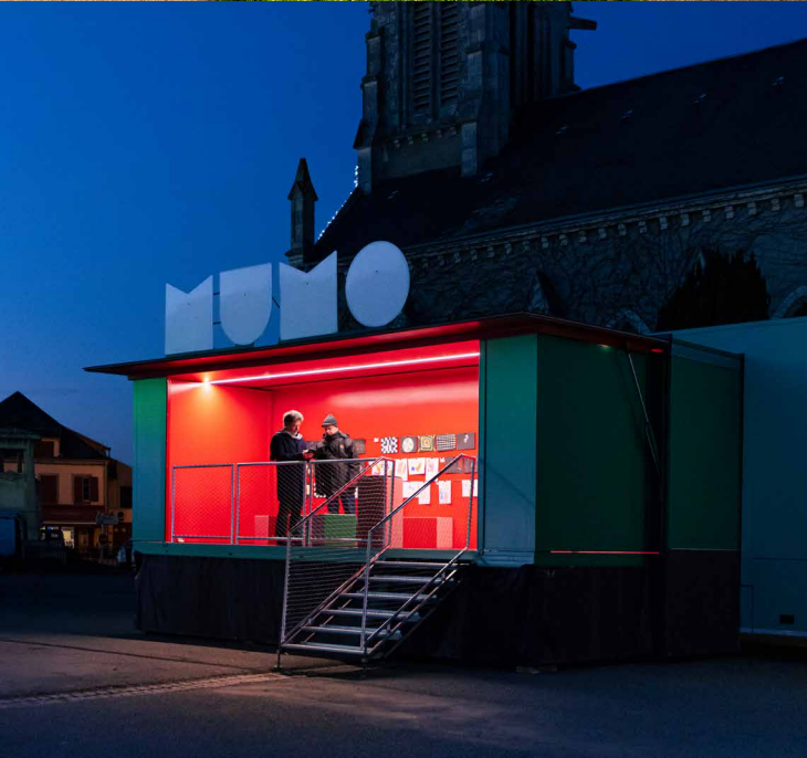
Le MuMo x Centre Pompidou conçu par Hérault Arnod Architectures et Krijn de Koning, artiste © Quentin Chevrier.