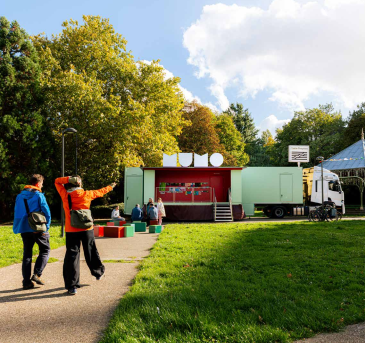
Le MuMo x Centre Pompidou conçu par Hérault Arnod Architectures et Krijn de Koning, artiste.