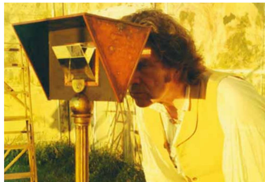
Les Trois Petits Cochons , 2012 © Román Bayarri

Samedi 4 mai, 17h30, Petite salle, entrée libre