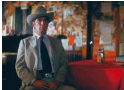
Electra Glide in Blue, 1973

Samedi 4 mai, 20h00, Cinéma 2, Séance présentée par Albert Serra et Abel Ferrara (cinéaste) [sous réserve]