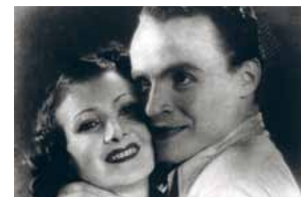
Innocence Unprotected, 1968