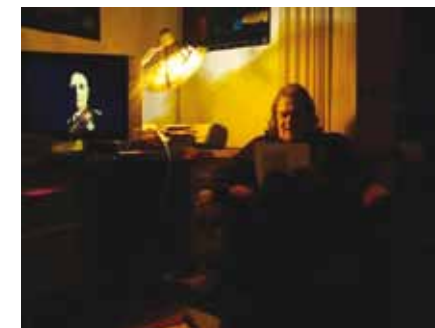
Lectura d'un poema, 2010

Jeudi 18 avril, 20h, Cinéma 2, séance présentée par Albert Serra Vendredi 10 mai, 20h, Cinéma 2