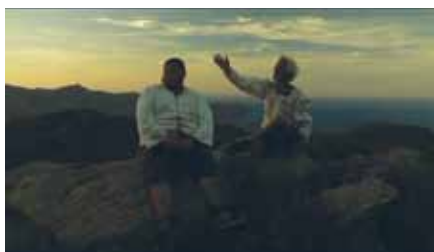
Sant Pere de Rodes, 2006

Samedi 4 mai, 20h, Cinéma 2, séance présentée par Albert Serra