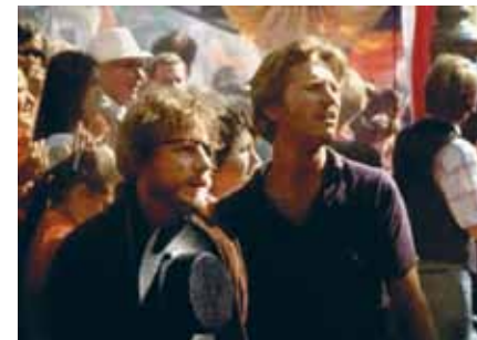
Cutter's Way, 1981