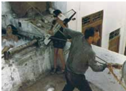
Viva la muerte, 1971