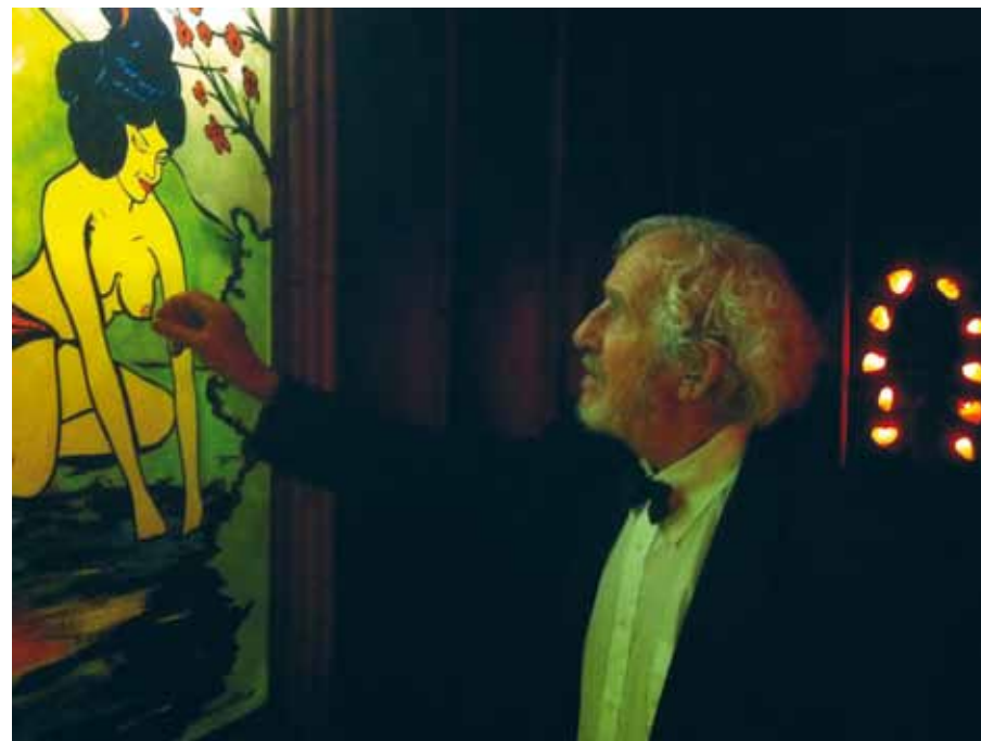
Les Trois Petits Cochons , 2012 © Jordi Mitjà

Le film est projeté sur grand écran, au Forum -1, par séquences de 10 heures, tous les jours, à partir de 11h30.