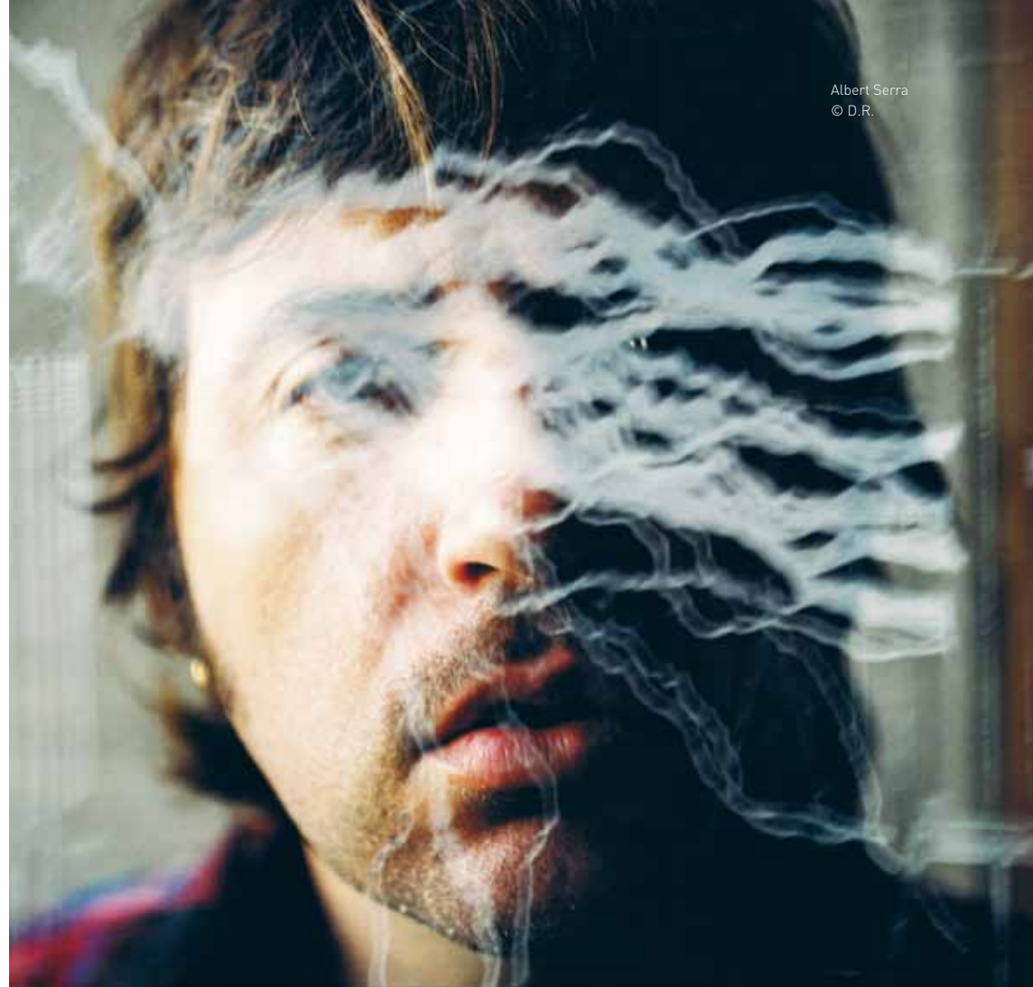
Albert Serra

Tout compte fait, le problème est simple : des personnages comme Hitler, Dalí ou Warhol sont à la fois eux-mêmes et leur propre caricature. Ils ont fait le travail pour nous avant que quelqu'un ne s'attelle à la tâche et quand ils se sont présentés au monde, au grand public, ils l'ont fait avec leur lecture incorporée en eux, la plus impitoyable possible. C'était, en effet, celle qui pouvait les blesser le plus, la plus caricaturale. Dans chacune de leurs apparitions, chaque image publique (en fait, ils n'ont rien de privé afin d'éviter que quelqu'un les regarde secrètement, c'est pourquoi ils s'exposent en permanence, ce qui équivaut, en fait,