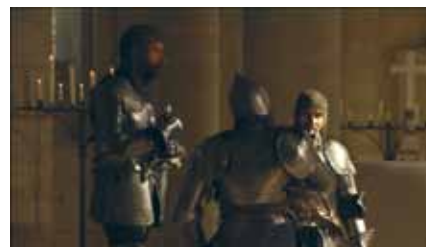
L'Alto Arrigo, 2008 © Andergraun Films