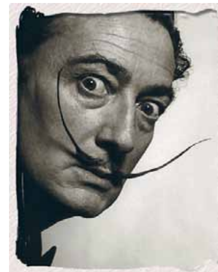
Droits d'Image de Salvador Dalí réservés. Fundació Gala-Salvador Dalí, Figueras, 2012.