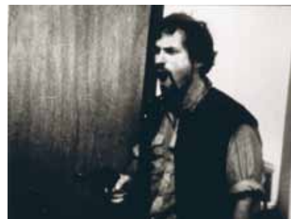
Beyond the Law, 1968