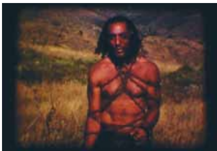
Super 8, 2006

Samedi 20 avril, 16h, Cinéma 2, séance présentée par Albert Serra Jeudi 9 mai, 20h, Cinéma 2