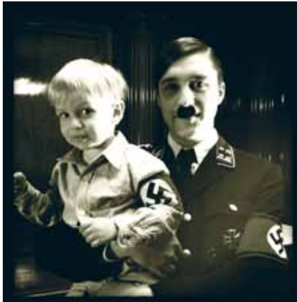
Les Trois Petits Cochons , 2012 © Jordi Mitjà

les observations de penseurs et de guides allemands sur la beauté, la vie, l'art, l'avenir, le passé, la nature, la technique, la politique ou sur tout ce qui est digne de discours – certaines parties étant même reprises plusieurs fois dans différentes bouches. Au fil des jours, l'argument louvoie, se noue et se dénoue. Le monde ne cesse de rayonner ; chaque image a du charme et de la force, chaque figurant(e) est considéré(e) avec amour, dans toutes ses hésitations, dans sa fragilité – comme représentant, comme médium. Ça et là, il arrive que se rencontrent ces figures allemandes – ça devient alors tout à fait surréaliste, l'air paraît se figer. Certes, ils ne peuvent pas vraiment parler l'un avec l'autre mais l'un vers l'autre, oui. Et, naturellement, tout ce qui a été énoncé ici en tant que règles ou observations admet des exceptions. Une seule chose est certaine : Les Trois Petits Cochons est une aventure absolument effarante, enrichissante et revigorante.