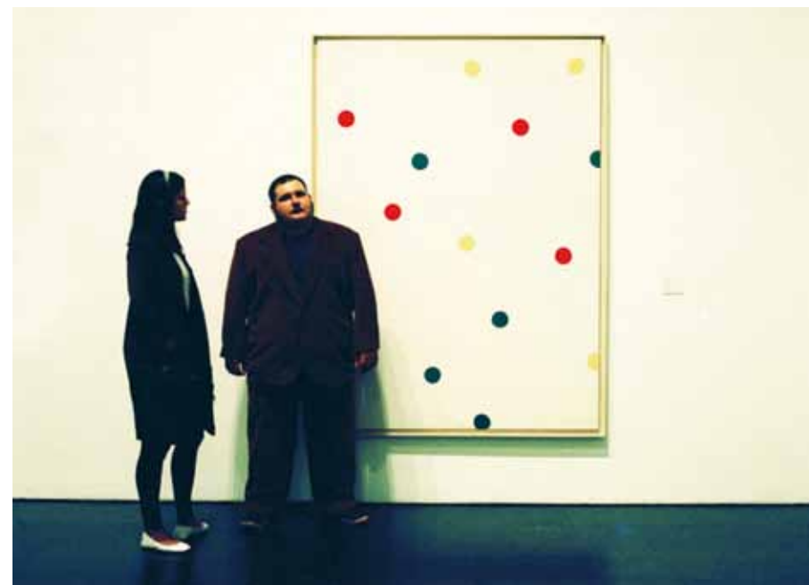
Les Noms du Christ, 2011 © Román Yñán